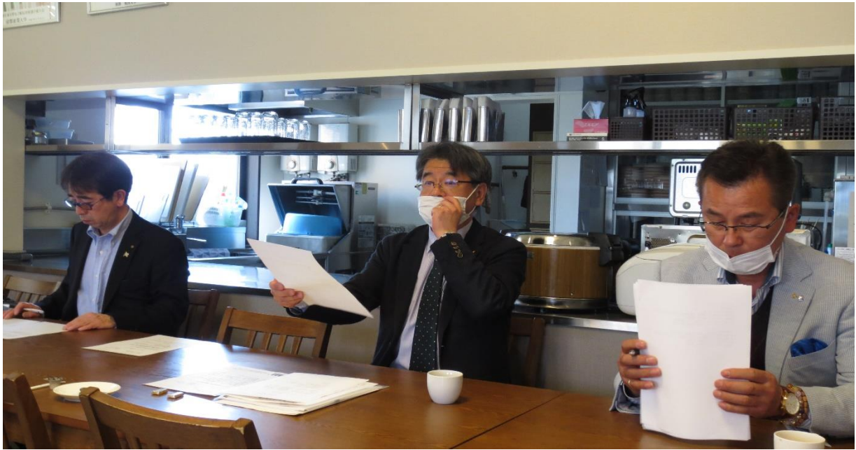
5月7日 臨時理事会をホテル杉田で開催：理事13名の参加でした。